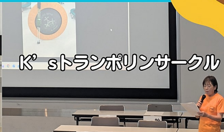
K'sトランポリンサークル