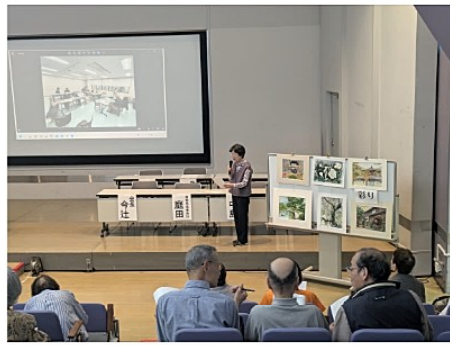
情報交換・交流会の様子